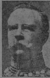
SR. DE LA BARRA