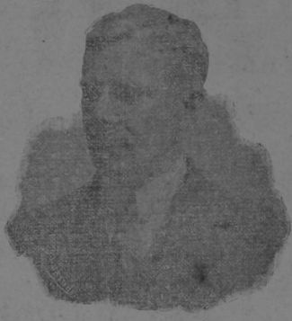
HON. SR. MARSHALL LANGHARNE

Al presentaros este Mensaje del Presidente de los Estados Unidos, aprovecho la oportunidad para significar a Su Excelencia mi sincera y cordial participación en sus sentimientos para expresar mi agradecimiento por la marcada cortesía con que vos y los funcionarios y el pueblo en general de la República me han recibido; y para augurar el gran porvenir que en mi entender espera a este país tan ricamente dotado por la naturaleza y a este pueblo tan afortunado en su historia y en su herencia como son los de Costa Rica.